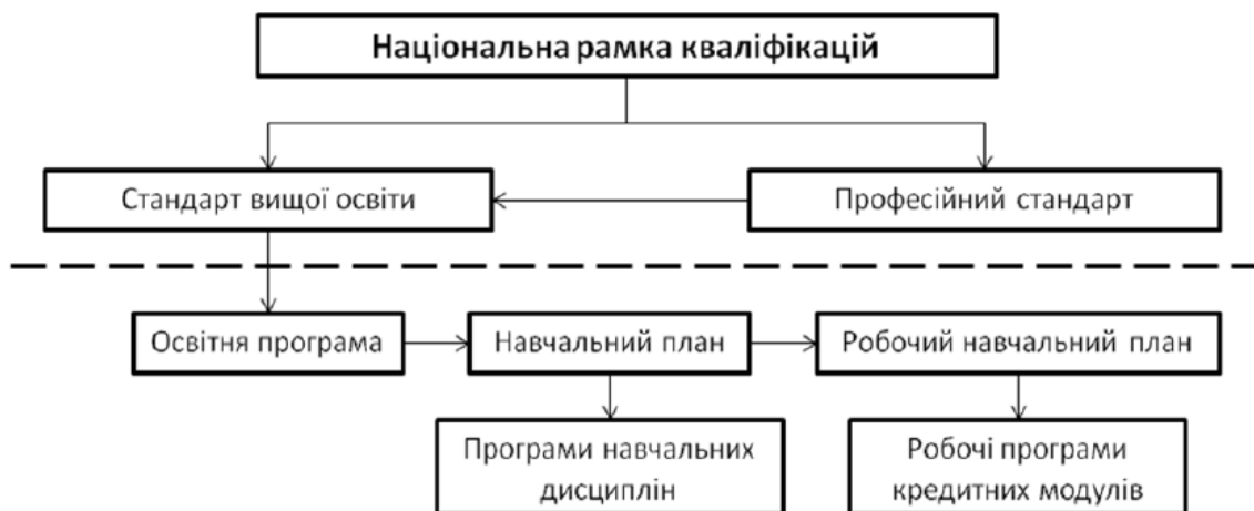
Рис. 1. Структура розроблення змісту освіти і навчання

Нормативні документи верхньої частини схеми (національна рамка кваліфікацій, професійні стандарти та стандарти вищої освіти) розробляються на рівні держави і затверджуються відповідними державними органами. Документи нижньої частини схеми розробляються й затверджуються в університеті.